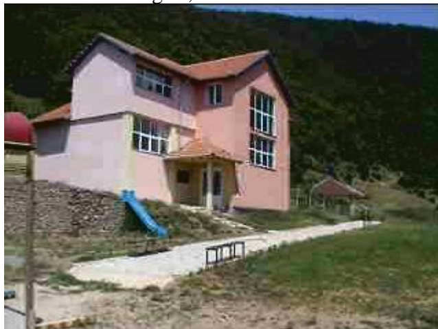
Anche se con un po' di fatica, inizia a crescere il prato intorno alla scuola.