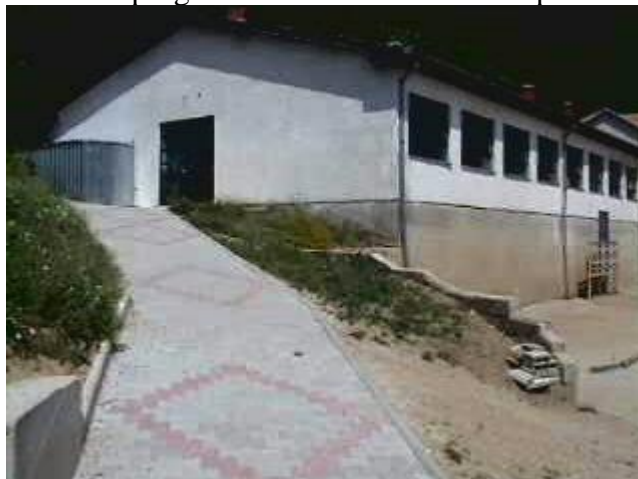
Sono stati realizzati anche i vialetti di collegamento tra le due strutture, sullo sfondo si intravede la casetta in metallo consegnata nell'ottobre 2006 nella quale ripongono la legna.