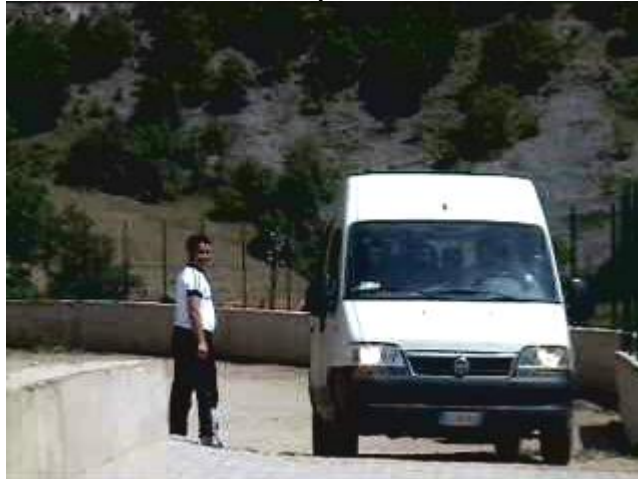
Seguendoci per tutta la manovra con lo sguardo sorridente.