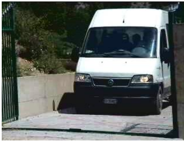
Ci lascia a mala pena far manovra.