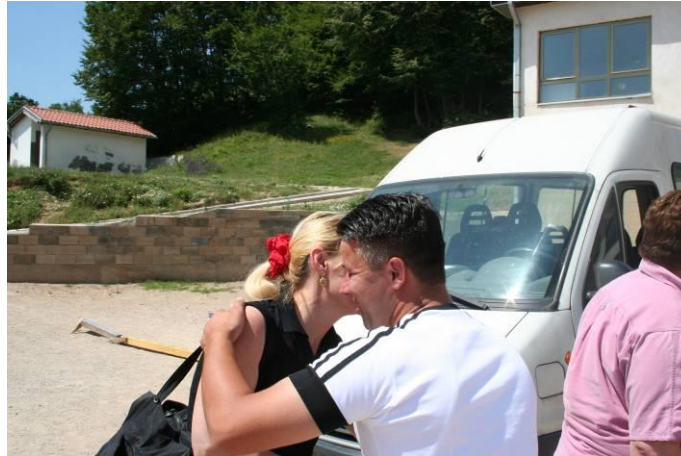
Incomincia la fase dei saluti e dello scambio d'informazioni sulle proprie famiglie.