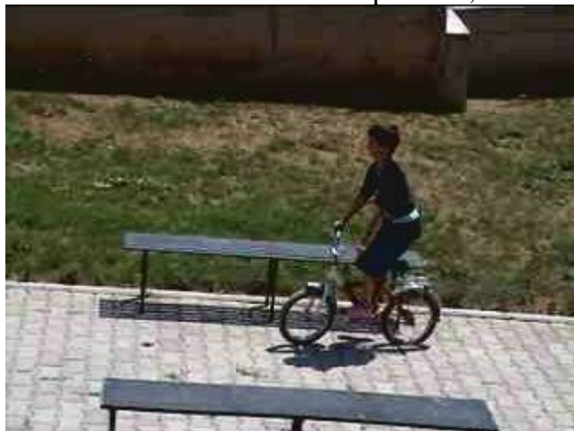
La notizia che sono arrivati gli italiani è iniziata a circolare e i bimbi arrivano. Chi in bicicletta!