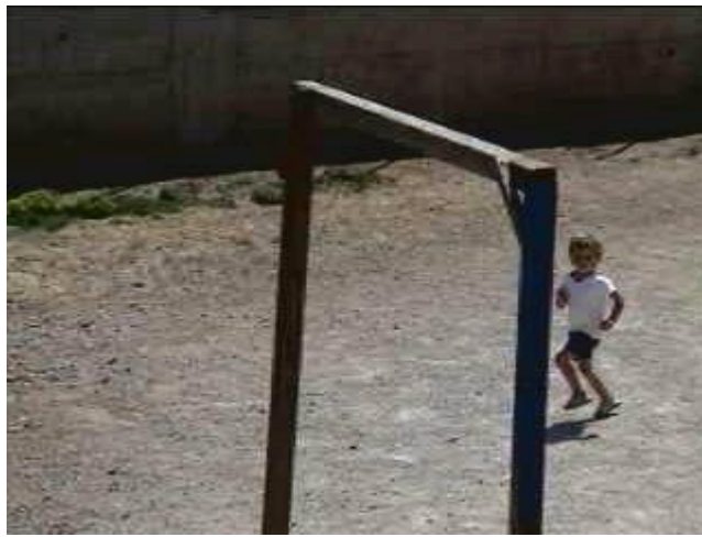
Chi di corsa!