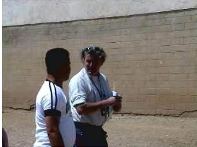
Si dirigono verso l'ufficio del preside e intanto si raccontano le cose avvenute nel periodo intercorso tra la scorsa visita e questa.