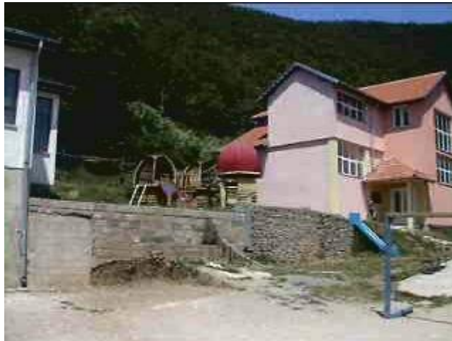
Notiamo subito che gli scivoli consegnati in aprile sono stati posizionati. Peccato che in questo momento non ci siano bambini in giro, ma sicuramente arriveranno.