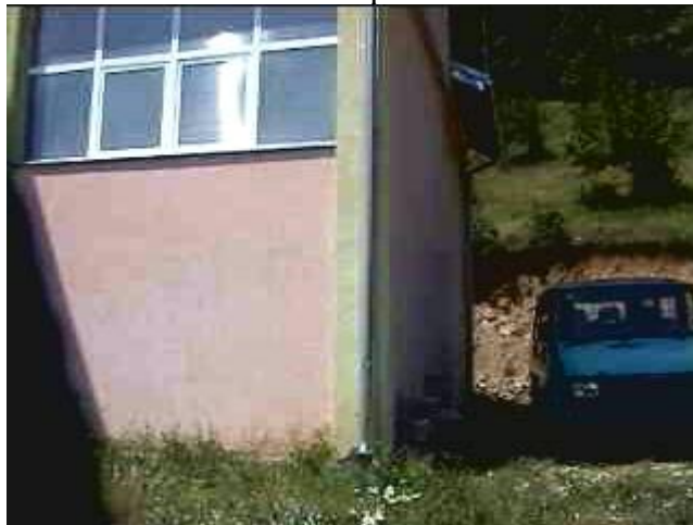
Posteggiato in un angolino intravediamo il nostro vecchio pulmino, ora svolge il servizio di scuola bus.