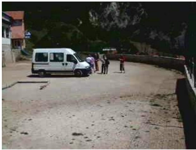
Finalmente siamo arrivati.