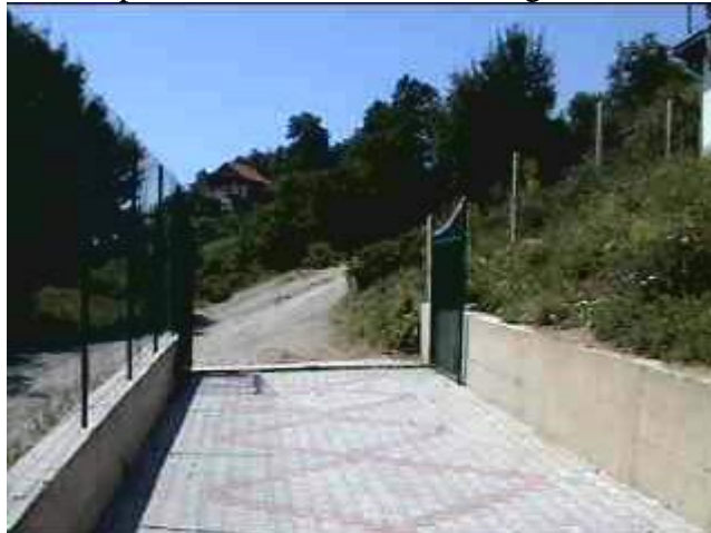
Le foto mostrano quanto sia cambiata l'intera area scolastica, cancellata, recinzione, pavimentazione. Tutto questo è il frutto del progetto realizzato nella scorsa primavera.