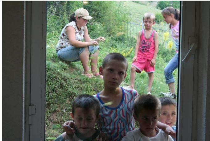
Altri davanti alla finestra dello studio, curiosi e timorosi per quello che poi toccherà a loro!