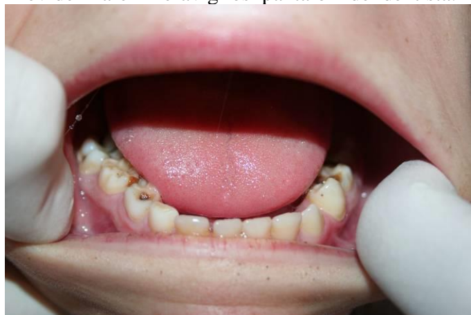
Quanto segue spiega senza bisogno di altre parole il perché del nostro progetto odontoiatrico.