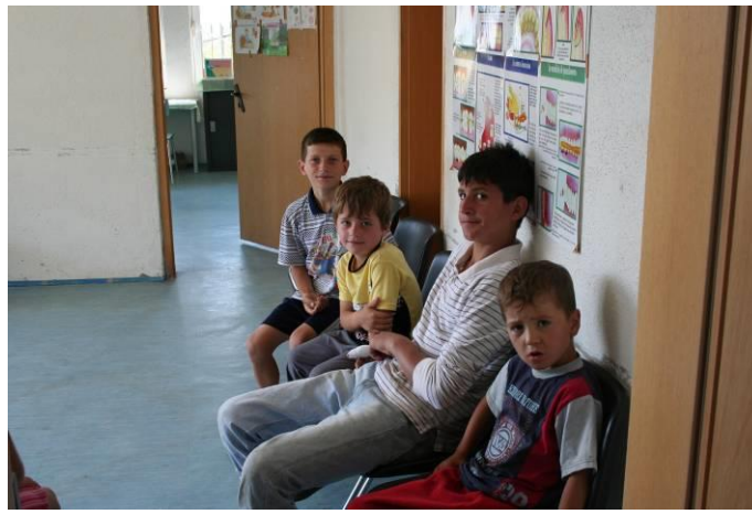
I nostri volontari lavoravano e fuori in attesa tanti bambini, alcuni in sala d'attesa...